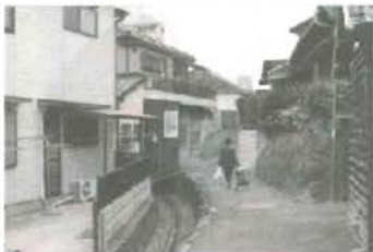
緊急車両が通行できない道路 (北九州市HPより)

また、新若戸道路は長年の懸 念となつている若戸大橋の渋滞 解消や、北 九州市全体 の経済浮揚 に効果が見 込まれるこ とから、早 期の完成が 期待されます。